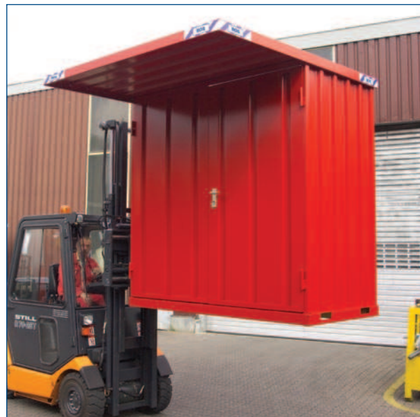
Einfach mit dem Stapler zu transportieren