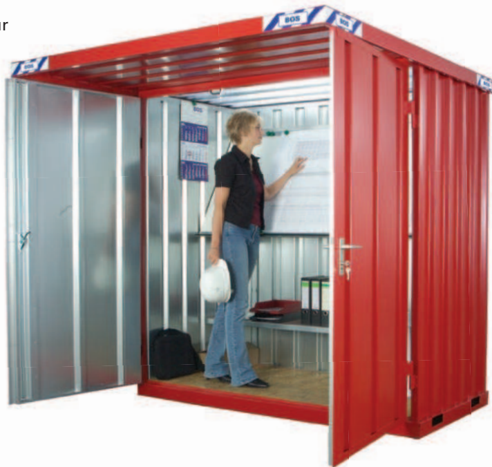
BPH mit optionaler Außenlackierung