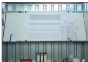
Zeichnungsablage + Regal