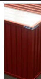
Lichtfeld im Dach