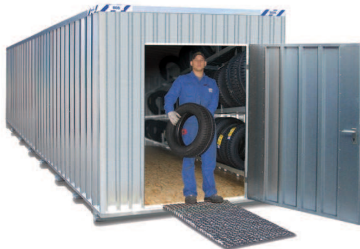
ReifenLager RL6000 mit optionaler Auffahrrampe