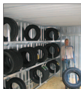
3 x 6 m Regallänge auf jeder Seite = 36 m Platz für Ihre Reifen