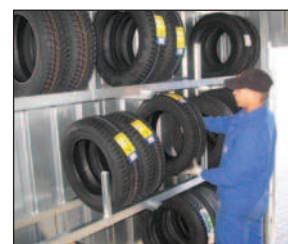
Dank Nischen: beide Längswände vollflächig nutzbar