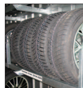
Stabile Reifenstützen verhindern ein Umkippen